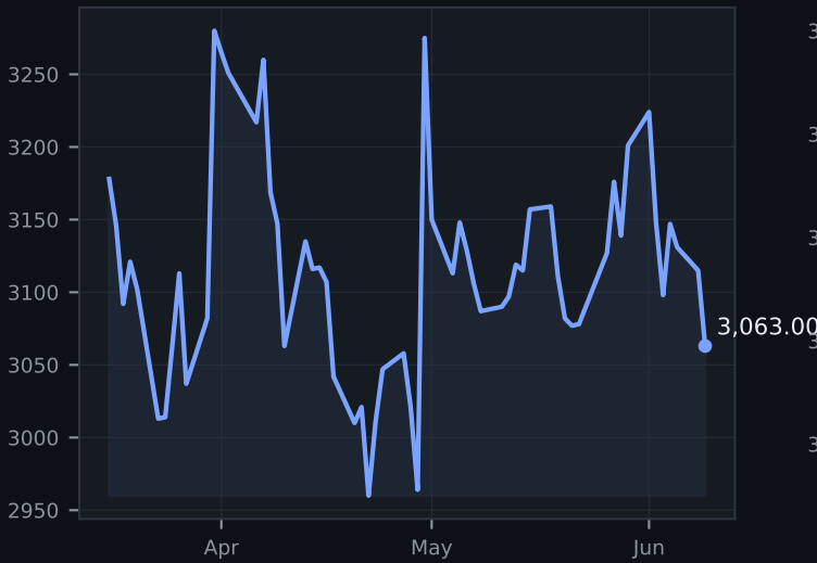
SOFR Volume ($B)