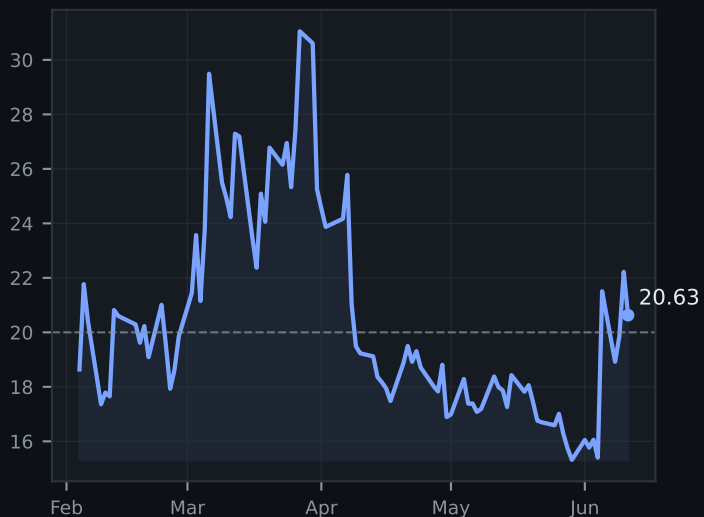
VIX (vol. equity)