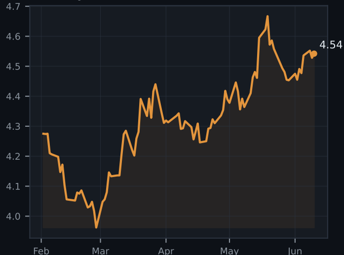
US10Y yield (%)